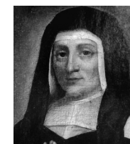
HL. LUISE VON MARILLAC (1591 – 1660) Mitbegründerin der Barmherzigen Schwestern

Als Priester in Südfrankreich setzte er sich in Zeiten von Hungersnot, Arbeitslosigkeit, Krieg und Armut für Kranke, Hungernde, Galeerensklaven und Aussätzige ein. Sein Leitsatz: „Armendienst ist Gottesdienst.“ 1734 wurde er in Rom heilig gesprochen.