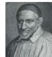
HL. VINZENZ VON PAUL (1582 – 1660)